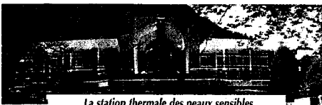
La station thermale des peaux sensibles

Ses propriétés bénéfiques dans de nombreuses affections dermatologiques sont utilisées à la station thermale d'Avène-les-Bains où sont dispensés des traitements dermatologiques de pointe.